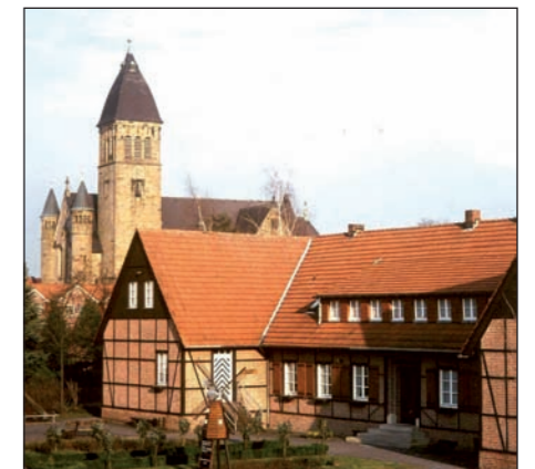
Das Heimathaus ist aus Lette nicht wegzudenken.

auf und will tragfähige Beschlüsse im Bezirksausschuss und im Rat ermöglichen.